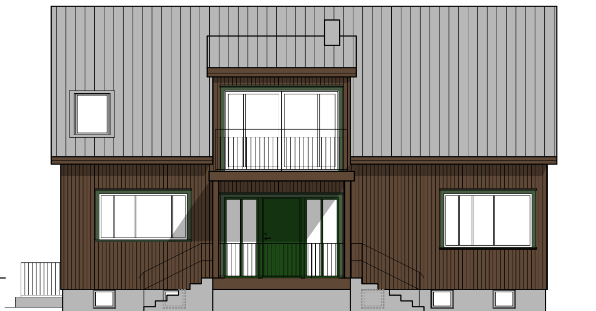
FASAD MOT SYDVÄST/RÖNNVÄGEN